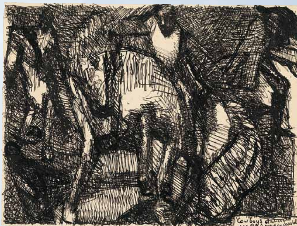
Louis Soutter Napoleon te paard Inkt op papier, 22 x 29 cm

Het is duidelijk; deze verzamelaar verzamelt én deelt zijn kennis, passie, organisatie-talent en netwerk met de groeiende schare liefhebbers van Outsider Art. Dit ‘beste paard van stal’ gunt het grote publiek vanaf 2010 inzage in een van de grootste particuliere collecties Outsider Art die de wereld rijk is. Wij houden u uiteraard op de hoogte.