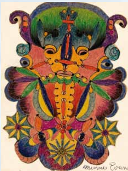
Minnie Evans Zonder titel, 1945 Kleurpotlood op papier, 31 x 23 cm